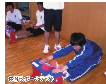
体育スポーツテスト