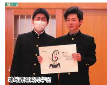
地域課題発見学習

1年次 2年次 3年次 芸術で希望選択がありますが、それ以外は全員共通の内容を学習します。1年間幅広く学ぶ中で、じっくりと、自分の学習に対する関心・意欲、自分の将来の進路について考えることができます。 希望に応じて、文系と理系に分かれます。国語や地理歴史の時間数を多くした文系と、数学や理科の時間数を多くした理系に分かれます。 高校入試は全員5教科ですが、高校から進学や就職するときに課される科目は、色々なパターンがあるのでそれに対応したカリキュラムです。 理系はそのまま3年に進級します。文系は、さらに公立大学・私立大学・短大・専門学校・就職を目指す文Iクラスと、主に国公立大学を目指す文IIクラスに分かれます。 特に文Iはたくさんの選択科目を開講しています。知識の習得だけでなく芸術を究めることもできます。