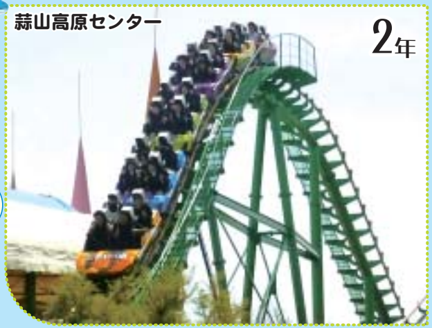
蒜山高原センター