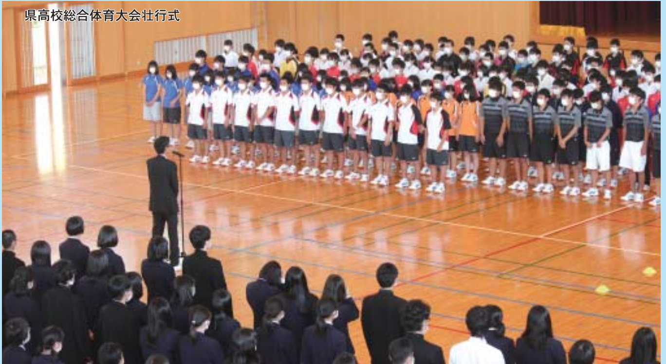
県高校総合体育大会壮行式