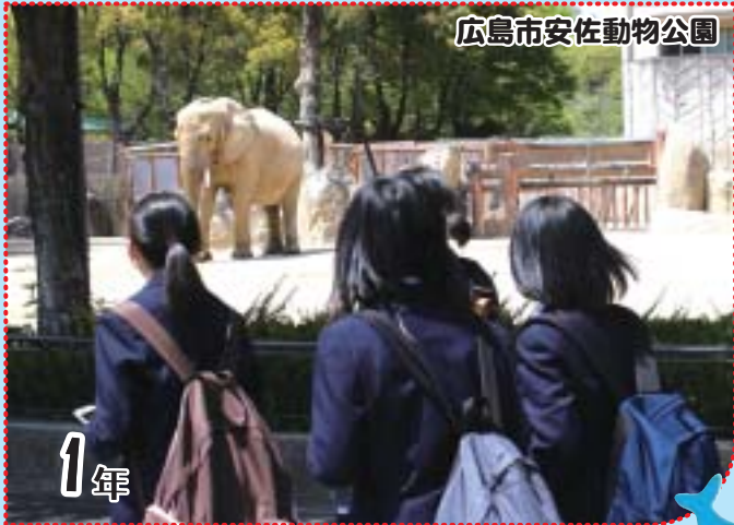
広島市安佐動物公園